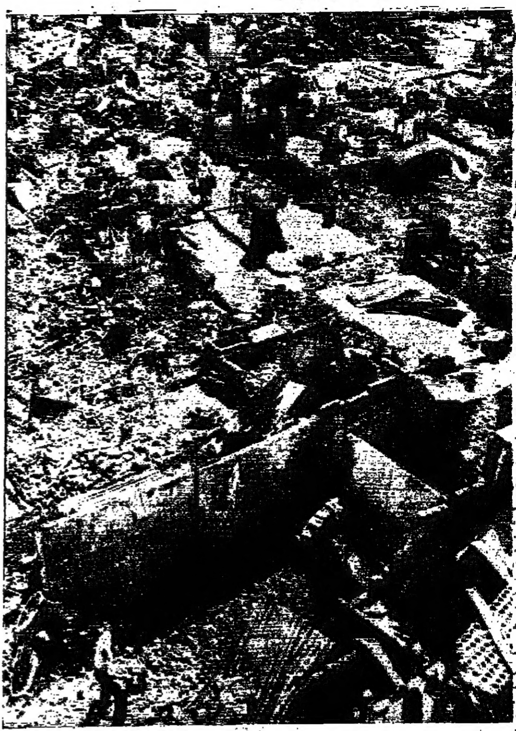
المكان يعودون الى المخيم للاطلاع على ما فعلته القوات الجوية المصرية في جنوب سيناء...